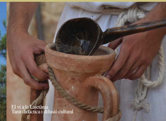
El vi a La Laietania Tanit didàctica i difusió cultural