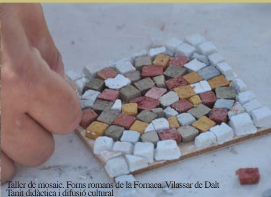
Taller de mosaic. Forn romans de la Fornaca, Vilassar de Dalt Tanit didàctica i difusió cultural

Preu: 4 euros Lloc de trobada: Museu de l'Estampació de Premià de Mar. C/Joan XXIII, 2-8. Premià de Mar. Reserva prèvia: museu@premiademar.cat T. 93 752 91 97 Organitza: Museu de l'Estampació de Premià de Mar