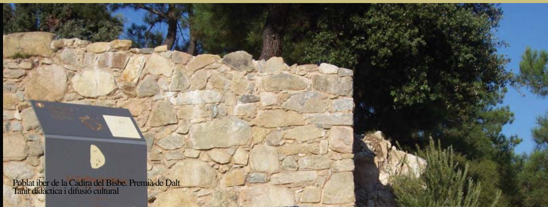
Poblat ibèric de la Cadira del Bisbe. Premià de Dalt Tanit didàctica i difusió cultural