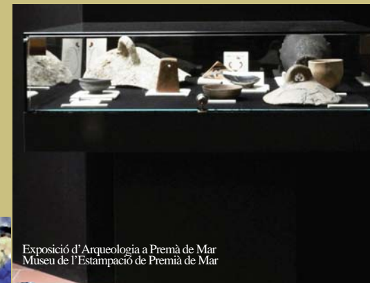
Exposició d'Arqueologia a Premià de Mar Museu de l'Estampació de Premià de Mar

C/ Joan XXIII, 2-8. Premià de Mar T. 93 752 91 97 www.museuestampacio.org museu@premiademar.cat