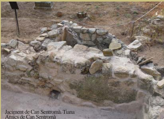
Jaciment de Can Sentromà, Tiana Amics de Can Sentromà

23 de setembre; 6 i 7 d'octubre a les 11.00h El Museu de l'Estampació de Premià de Mar ofereix una exposició que mostra mil anys de la història més antiga de Premià, des de l'època ibèrica fins a l'antiguitat tardana. A l'exposició es mostren objectes procedents de les excavacions que s'han anat realitzant en els darrers quaranta anys, des del Museu de Premià de Mar. A través d'aquestes peces, s'explica com vivien aquells antics pobladors de la vall de Premià. El jaciment estrella de la mostra és Can Ferrerons, les restes de les quals són les més importants i singulars de Premià i una de les més valuoses de tot el país.