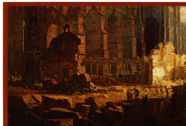
La démolition du rempart de Bordeaux au XIX e siècle (Léo Drouyn)