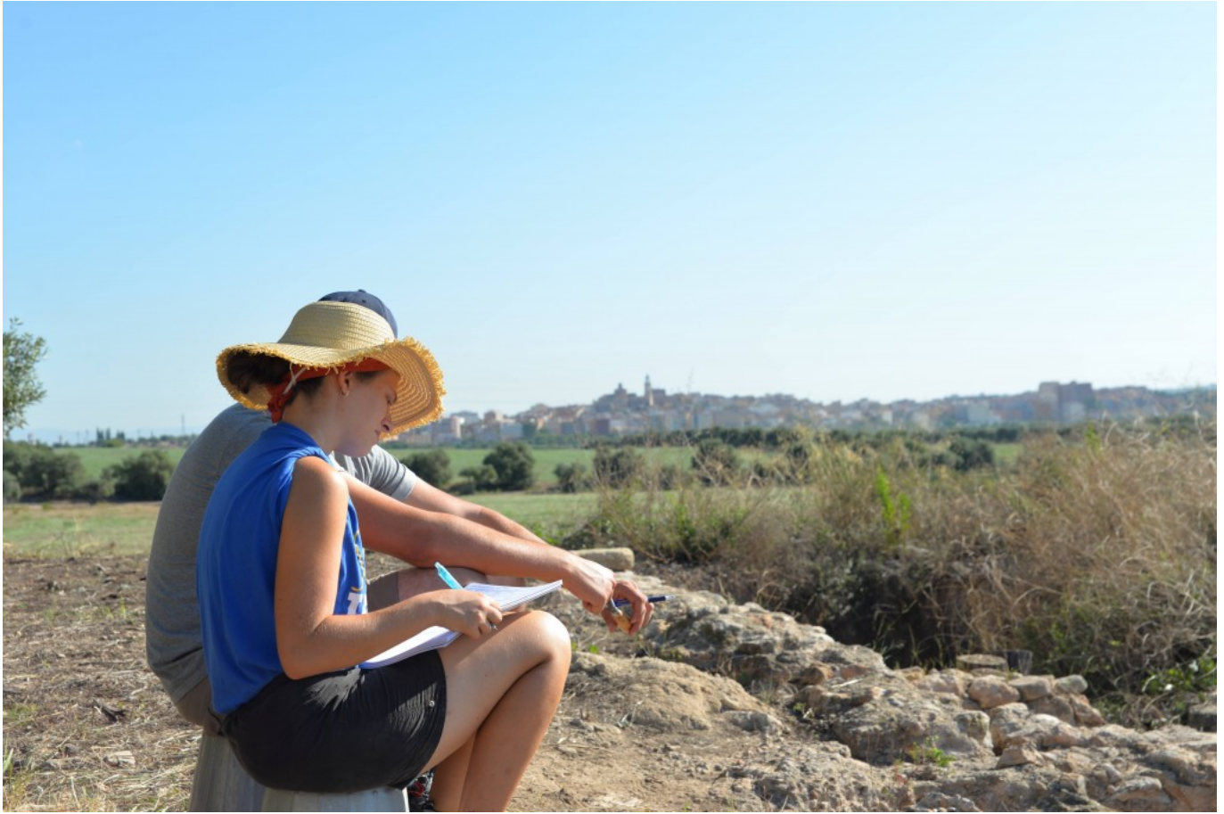
Investigadores en formación trabajando en el yacimiento de Mas dels Frares (2019).