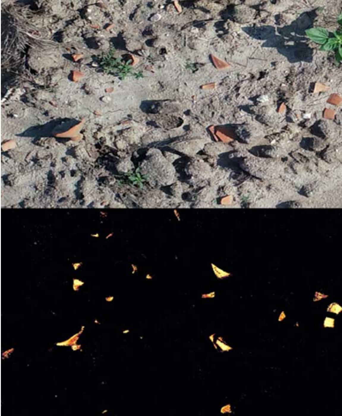
Imagen superior que muestra una imagen captada por drones. Imagen inferior que muestra las piezas detectadas por el algoritmo de aprendizaje automático (Arnau Garcia-Molsosa y Hector A. Orengo)