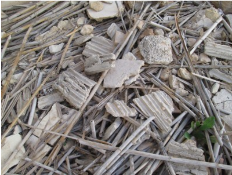
Restes constructives en una construcció recent enderrocada.