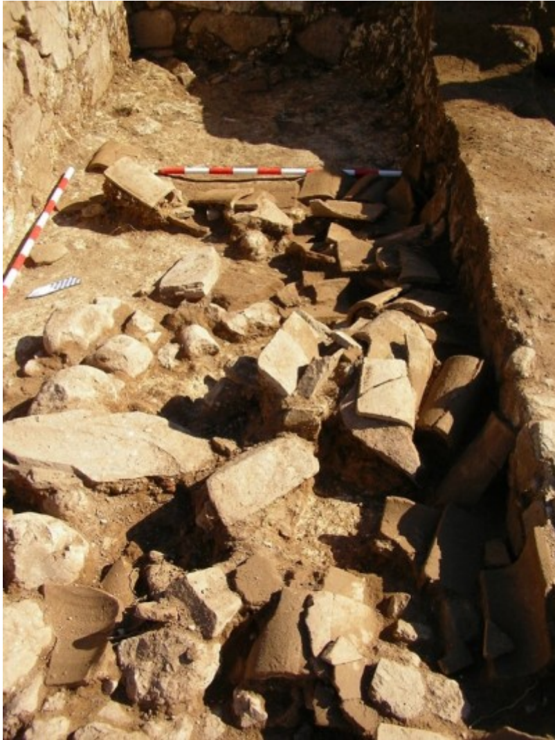
Enderroc de teules de Can Tacó. Foto: Equip Can Tacó (2020).