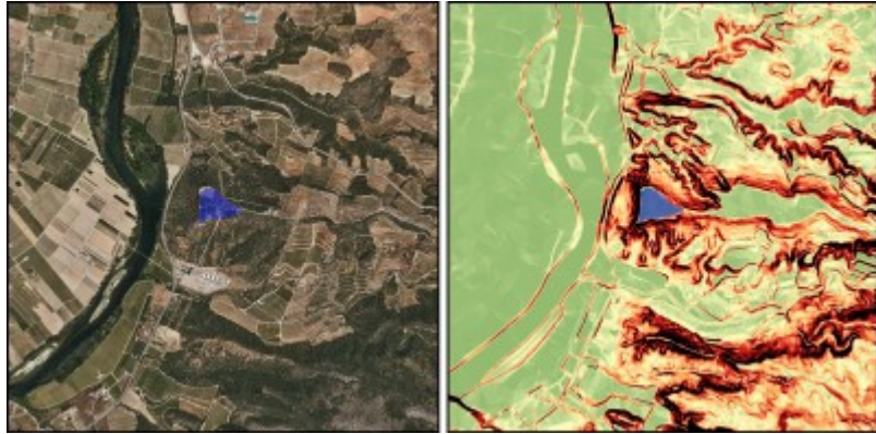
Exemple d'aplicació GIS a l'estudi de fortificacions. Castellet de Banyoles de Tivissa.