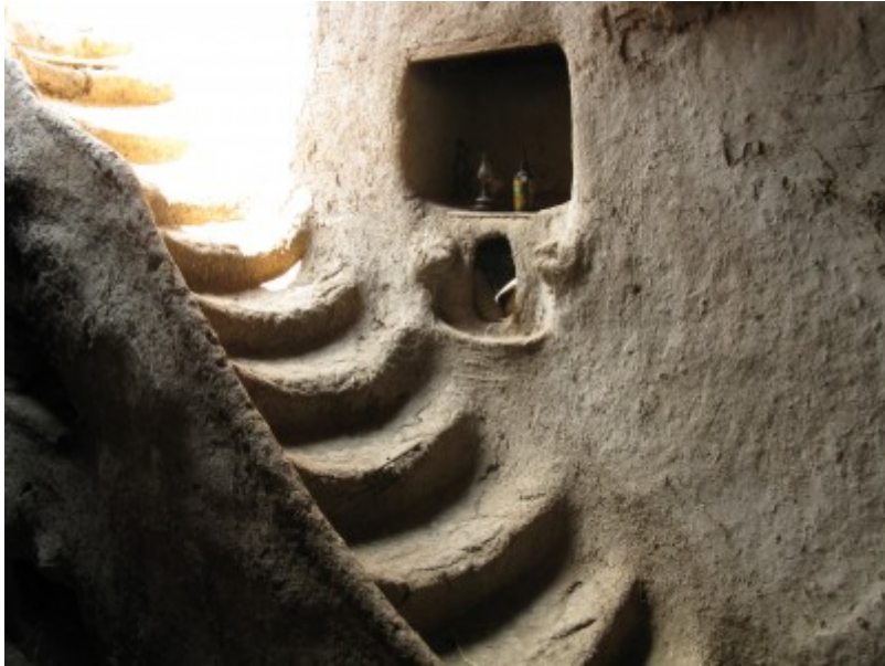
Exemple actual de casa de toves a Egipte.