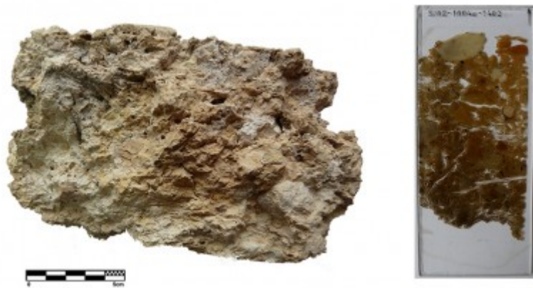
Fragment de sostre de fang del jaciment de Sant Jaume - Mas d'en Serrà (Alcanar, Montsià).