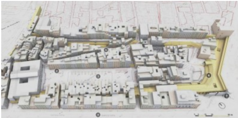
Circ romà de Tarragona. Mostra model mapa de punts obtingut a partir de l'escàner làser.