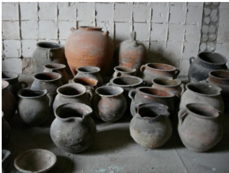
Mostra de ceràmiques de la Casa de la Convalescència de Vic.

Aquestes dades són molt útils a l'hora de determinar l'origen de les mostres i si es tracta de productes originals d'alta qualitat importats a localitats de consum o bé imitacions de menor qualitat produïdes localment. Així doncs, els microcristalls dels vidriats fan de marcadors tecnològics , ens informen de les tecnologies ceràmiques, els coneixements i les habilitats tècniques dels artesans, la consciència del comportament físic de les matèries primeres i la transferència de coneixement entre cultures i regions.