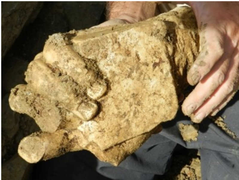
Fragment d'escultura d'una mà.

A l'interior de la cel·la del temple s'ha trobat paviment d' opus signinum rectangular davant d'un basament d'obra sobre el qual hi hauria l'estàtua de culte. A les parets es conserven restes de la decoració pintada. També ha aparegut un altre basament d'estàtua de granit.