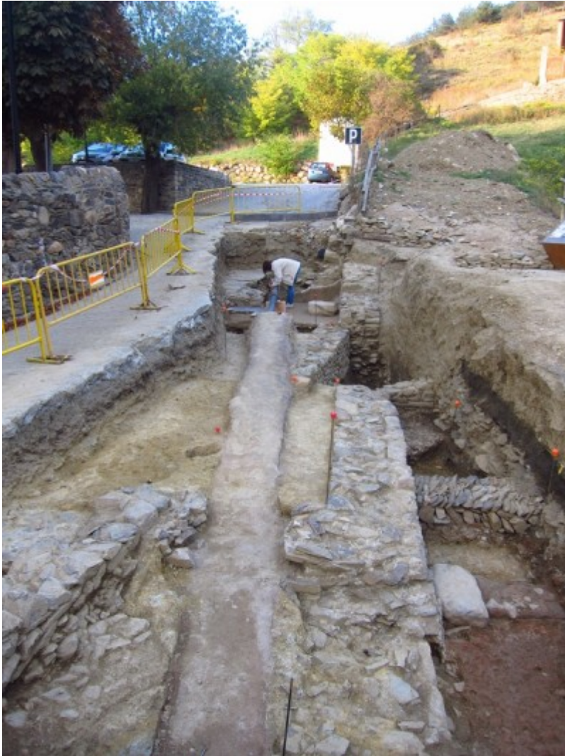
Vista general de l'excavació d'enguany.