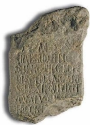
CE 1014, 1062 (Tarraco).