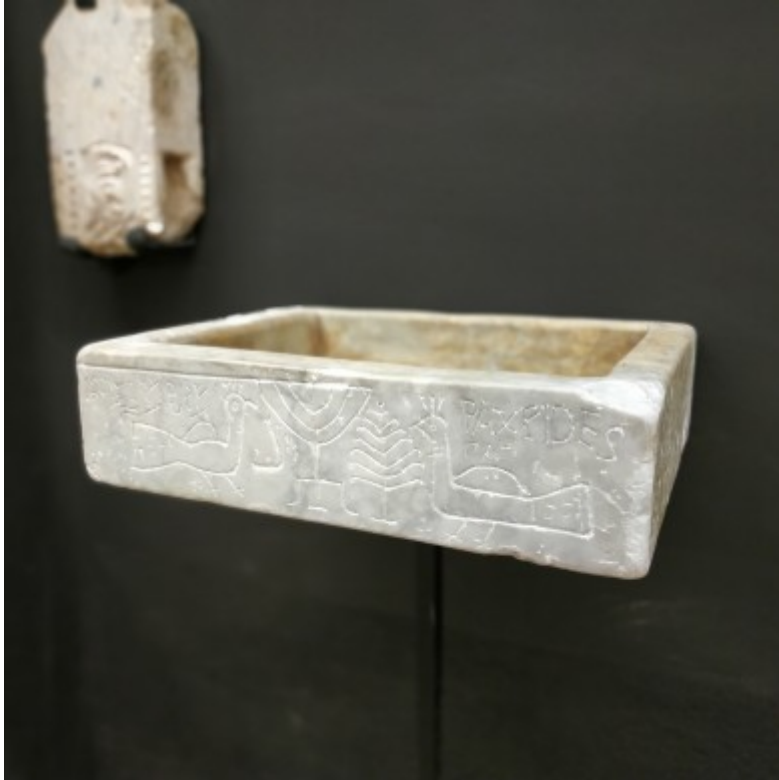
TarraAcroPolis Pileta trilingüe