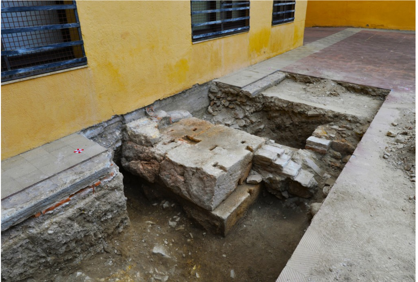
Intervención arqueológica en el patio del Museo Bíblico. Descubierta de la cimentación del muro de cierre del recinto de culto imperial