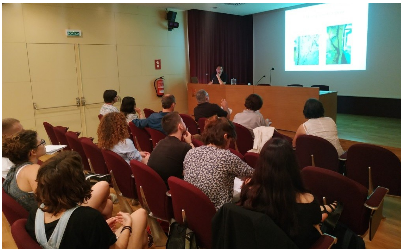
Defensa pública dels TFM en la convocatòria de juny de 2019, a la Sala d'actes de l'ICAC. Foto:

Consulta tota la informació del màster a: Màster interuniversitari en Arqueologia Clàssica - 12a edició